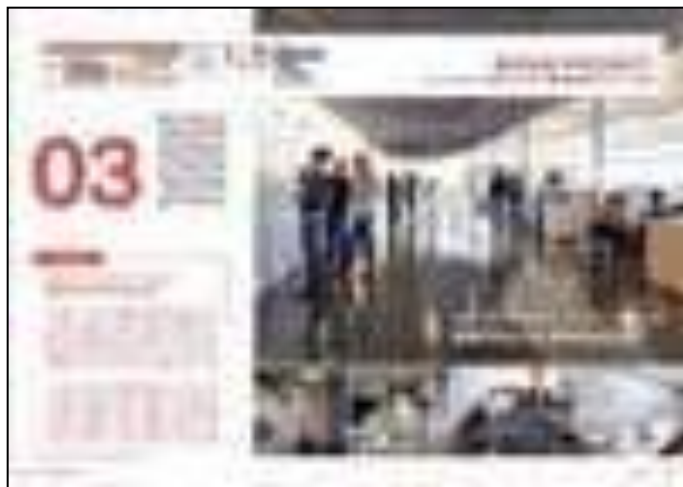
【4ページ 掲載パターンC】1-2ページ目