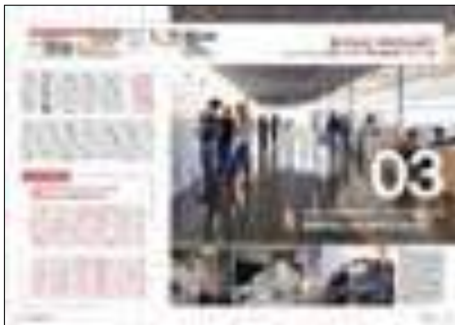
【2ページ 掲載パターンA】