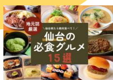
SEOに強いグルメ特集