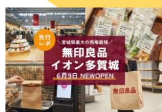
新店レポート記事