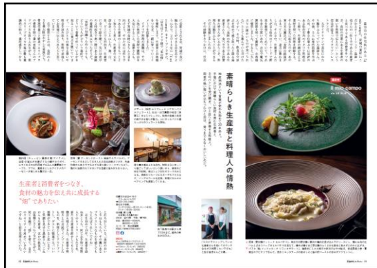
▲2024 秋冬号「宮城はおいしい」