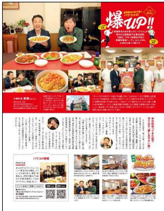
『中国料理 豊園』様(飲食店)