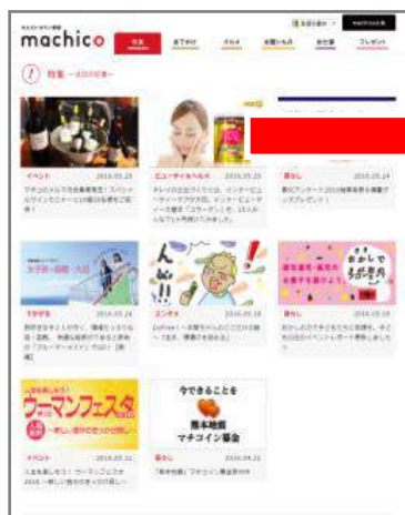
▼特集ページ(定型デザイン例)

S-styleで取材した情報を元に、『せんだいタウン情報machico』で商品やサービス、イベント等、PRしたい内容を配信することができます。PRページには、コメント投稿機能もセットし、ご希望のテーマでコメントを募集することができます。