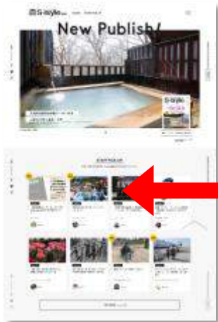
記事掲載イメージ