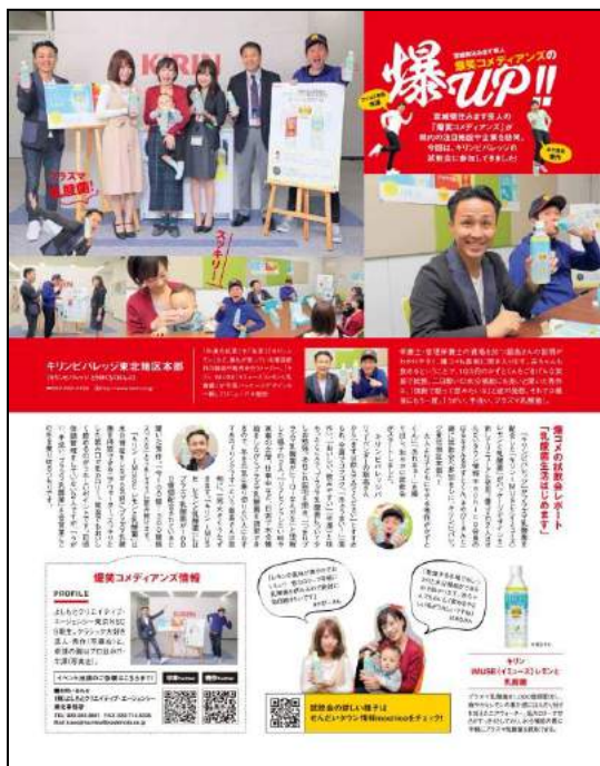
『麒麟ビバレッジ』様(飲料メーカー)

飲食店、物販店、その他サービス施設、新商品のご紹介など、2013年の連載開始から50を超える施設や商品をご紹介してきました。