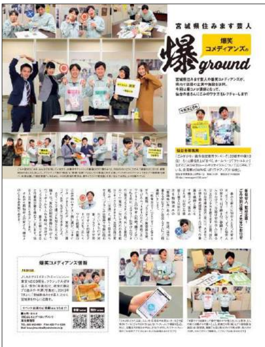
『仙台市環境局』様(自治体)